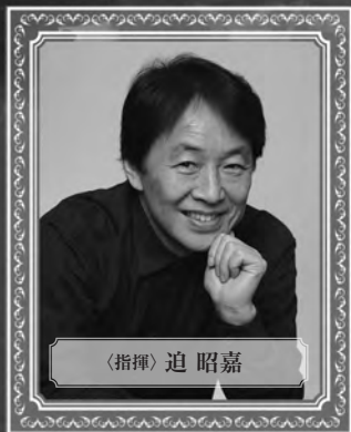
〈指揮〉 迫 昭嘉

東京藝術大学及び東京藝術大学大学院、ミュンヘン音楽大学マスタークラス修了。クワイター賞、ジュネーヴ国際音楽コンクール最高位、民音コンクール室内楽部門優勝、ハエン国際ピアノコンクール優勝およびスペイン音楽賞、ABC国際音楽賞受賞。気品ある音色と透明度の高いリシズムを持つピアニストとして、日本はもとより海外でもソロ、オーケストラとの共演のほか、室内楽奏者としても内外の線で活躍する演奏家達と数多く共演し、いずれも高い評価と信頼を得てきた。指揮者としては1999年に九州交響楽団でデビュー。その後も札幌、群響、新日本フィル、東京シティフィル、都響、神奈川フィル、名古屋フィル、京都市響、日本センチュリー響、関西フィル、藝大フィルなどの指揮台にも登場、緻密な音楽作りが話題となり今後の動向が注目されている。現在、東京藝術大学理事・副学長、音楽学部教授。